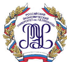
Российский экономический университет