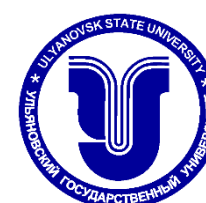
Ульяновский государственный университет